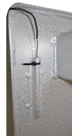
Рис.2. Аварийный термоограничитель